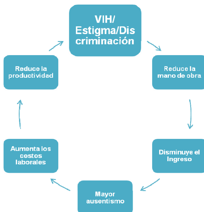
Figura 1. VIH: Un asunto de negocios, un asunto laboral.