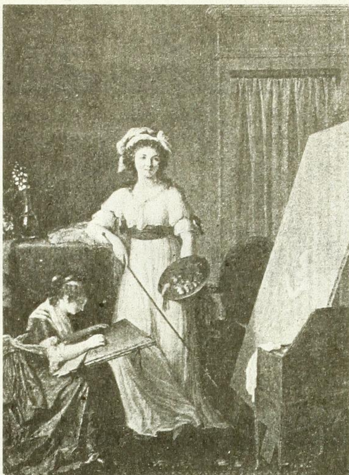
Marie-Victoire Lemoine, "Autorretrato", 1796

La situación de las pintoras mexicanas fue sin duda muy distinta a la de las europeas. En 1785 se fundó en