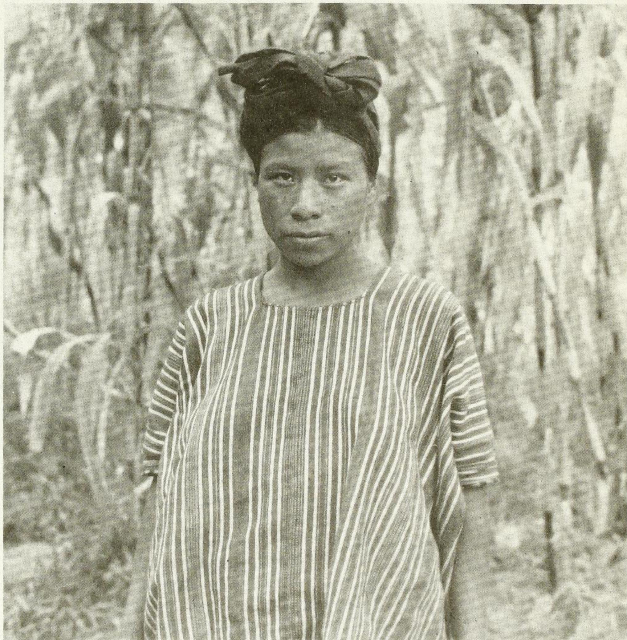
"Tejedora de Colotenango"