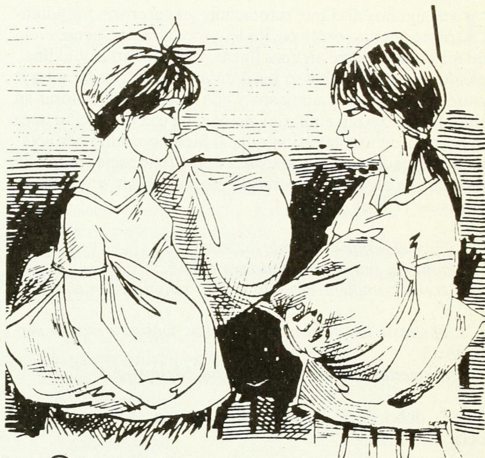
Rascón - La puerta s.

Cuando la diputada Ruiz terminó su carrera emigró a la capital y se hospedó en casa de Marco Rascón. Es a finales de