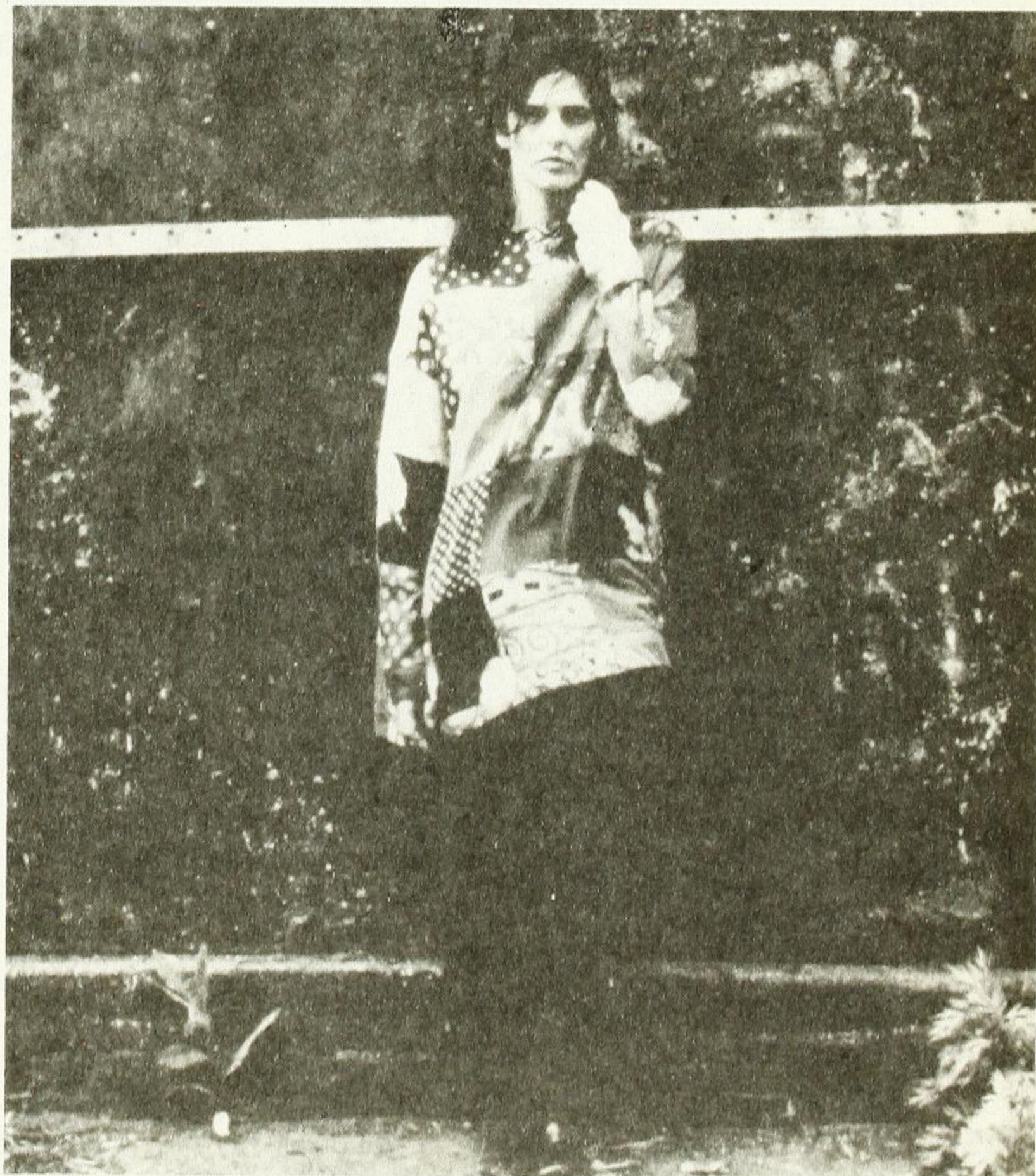
Sirena de Trapo , Cecilia Toussaint. Sony Music. Producción Eugenio Toussaint, 1993.