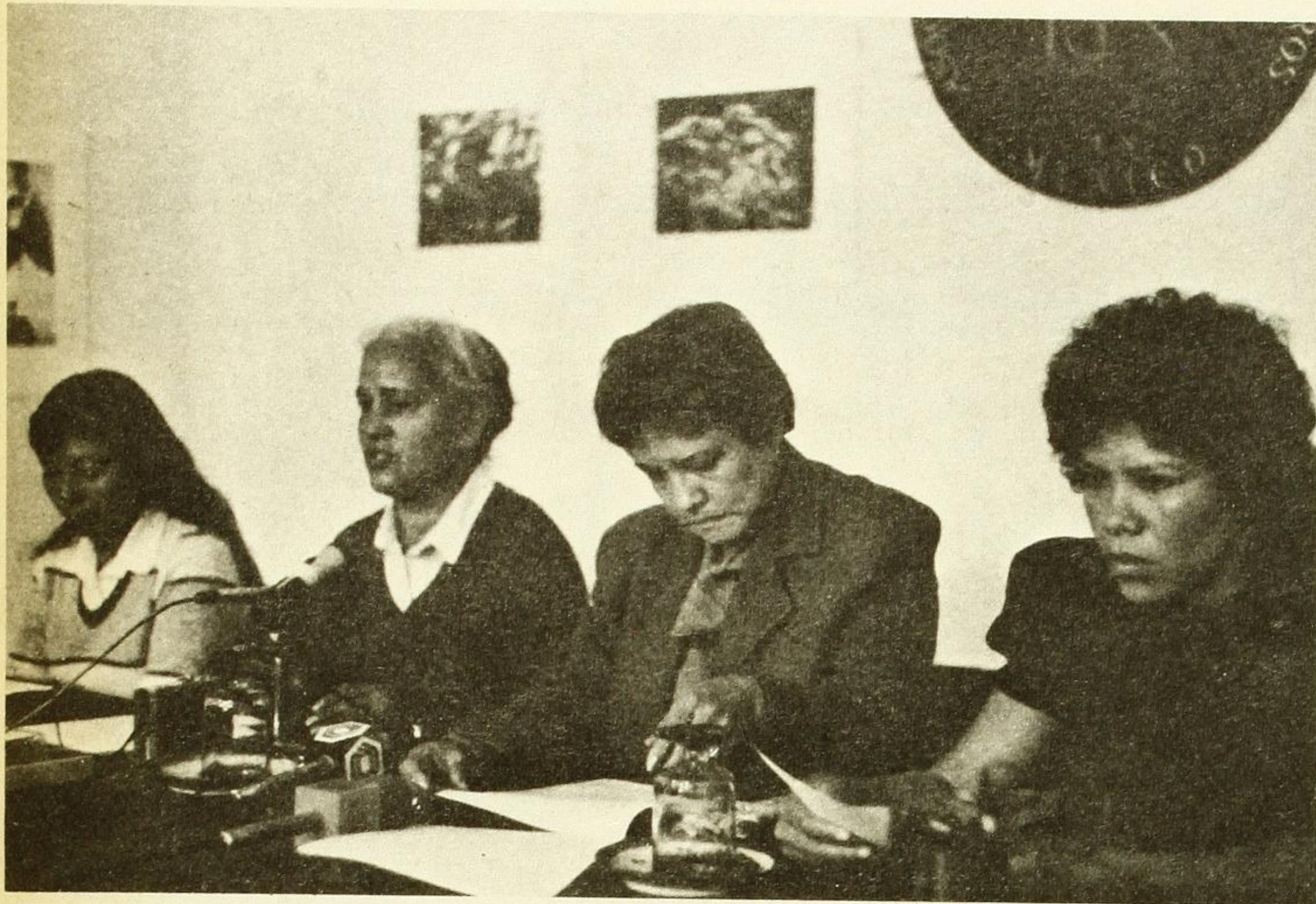
Comité Feminista de Solidaridad

venga aparte de la "overlock", la nobleza de una profesión que logra a fin de cuentas que no andemos con nuestras vergüenzas al aire: la de la costura".